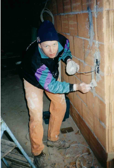
Selbst die Jungs mit Knie- und Rückenleiden waren dabei... "Gipsy"-King (wenn man sonst nichts kann)