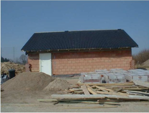
Das Gerätehaus im Mai 2002